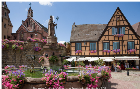
Place du Château